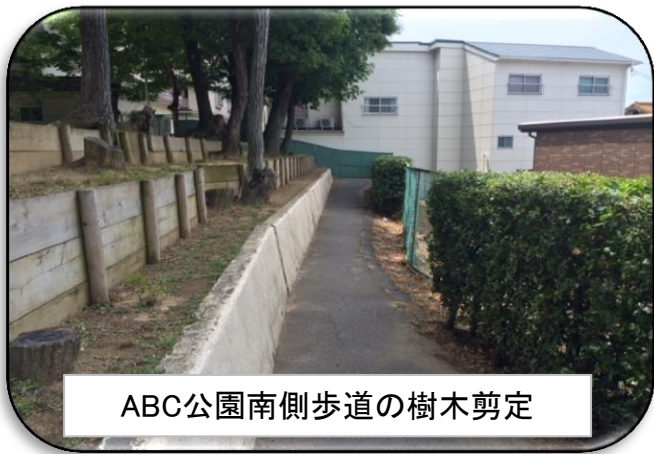
ABC公園南側歩道の樹木剪定