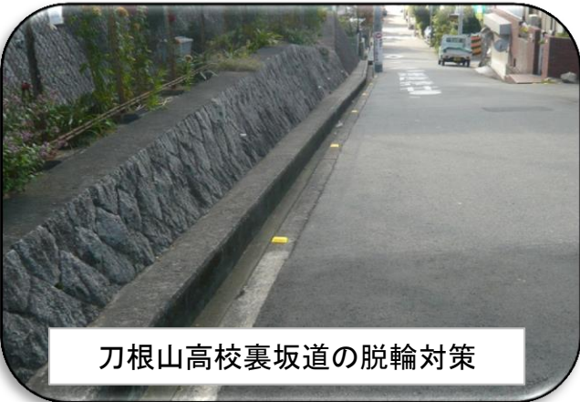
刀根山高校裏坂道の脱輪対策