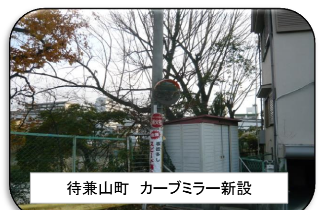
待兼山町 カーブミラー新設