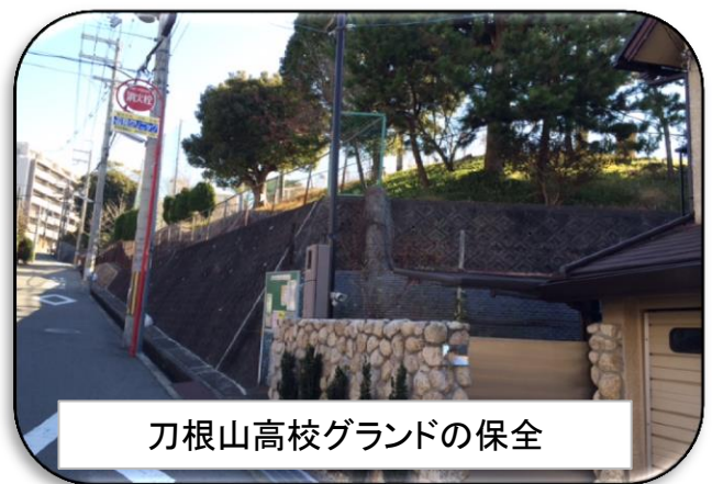
刀根山高校グラウンドの保全