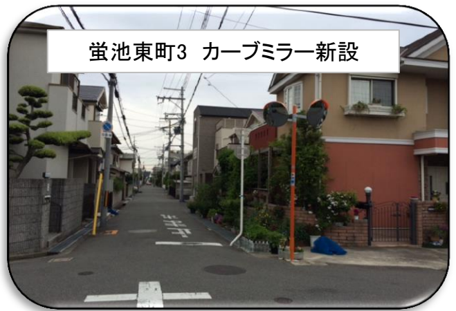
蛍池東町3 カーブミラー新設