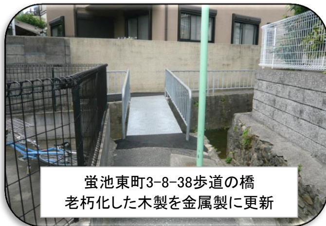
蛭池東町3-8-38歩道の橋 老朽化した木製を金属製に更新