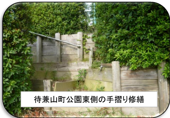
待兼山町公園東側の手摺り修繕