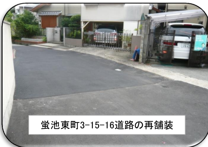
蛭池東町3-15-16道路の再舗装