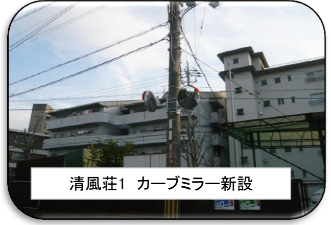
清風荘1 カーブミラー新設