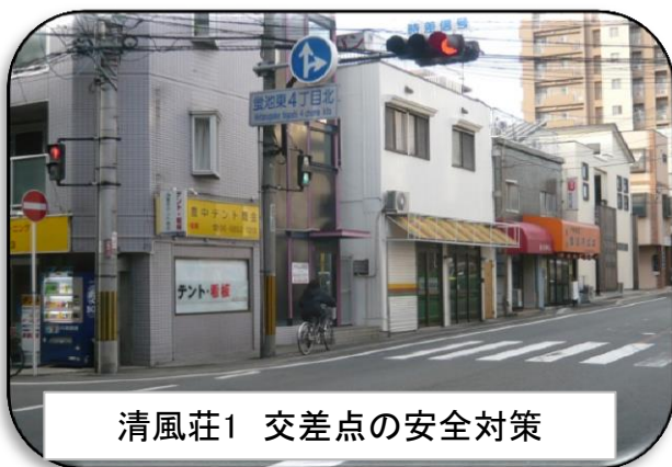
清風荘1 交差点の安全対策